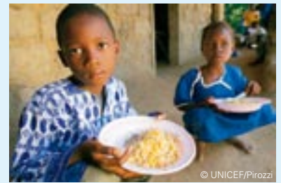
Börn snæða mat fyrir utan Kobelema skólann í Lofa-hér-aði í Líberíu.