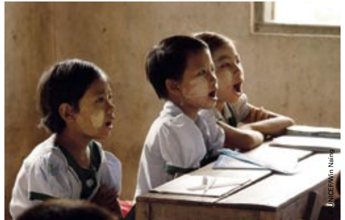
Nemendur í grunnskóla nr. 32 á sínum fyrsta skóladegi eftir hvirfilbyl- inn. Notaðu þurfti skólann þeirra sem tímabundið skjól fyrir fólk sem missti heimili sín. UNICEF setti nýtt þak á skólann og dreifði skóla- og leikja- pökkum.