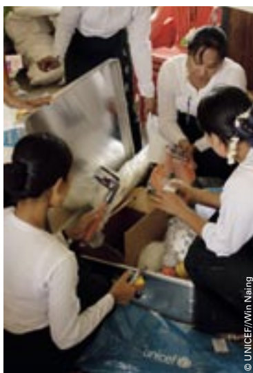
Kennarar í grunnskóla nr. 11 virða fyrir sér hjálpargögn frá UNICEF.