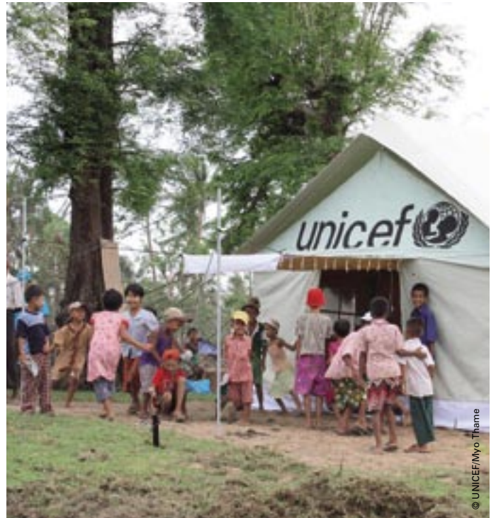
Hér má sjá skólatjald UNICEF sem sett var upp í þorpinu Kyane Chaung á Irrawaddy svæðinu. Tjaldið tekur alls 50 nemendur í bekk og stendur nú á sama stað og fyrrum þorpsskólinn sem eyðilagðist í hvirfilbylnum.