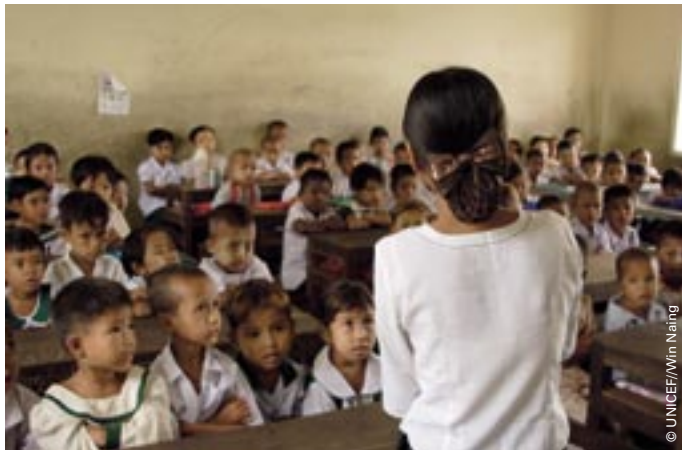
Það er alltaf spennandi að byrja í skóla. Börnin í grunnskóla nr. 11 í Yangon hafa þó þurft að upplifa meiri og öðruvísi spennu en jafnaldrar þeirra. Fresta þurfti setningu skólaársins vegna hvirfilbylsins, en hér má sjá börnin á sínum fyrsta skóladegi. Alls eru um 120 börn í bekknum. Skólinn fékk skóla- og leikjapakka frá UNICEF.

Enn er mikil þörf fyrir skjól, drykkjarhæft vatn, salerni, mat og lyf. Aðgangur að þeim svæðum, sem verst urðu úti, hefur verið nokkuð heftur hjálparstarfsfólki, en þó má áætla að hjálparstofnanir Sameinuðu þjóðanna hafi aðstoðað um 1,3 milljónir manna. UNICEF heldur áfram að dreifa nauðsynlegum sjúkragögnum, lyfjum og sérstakri næringu fyrir vannærð börn. UNICEF hefur einnig dreift skólagögnum og leikjapökkum til fyrrnefndra 4 þúsund skóla. Næstu sex mánuði horfir UNICEF fram á að auka aðstoð sína á sviði vatns og hreinlætis, sem og að veita börnum vernd og sameina fjölskyldur.