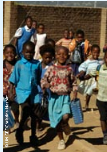
Nemendur á hlaupum á skólalóð Ndirande-skólans í Malaví. Uppbygging skólans var styrkt af UNICEF.

Reykjavíkumaraþon Íslandsbanka fer fram 22. ágúst nk. Eins og undanfarin ár gefst þátttakendum tækifæri til að tengjast sérstöku góðgerðarfélagi á heimasíðu hlaupsins og hvetja svo fólk til að heita á sig. Áheitin renna til góðgerðarfélagisins. Á hverju ári hefur fjöldi fólks valið UNICEF sem sitt góðgerðarfélag og fengið vini og vandamenn til að heita á sig. Skiptir sá stuðningur miklu máli. Við hvetjum alla hlaupara í hópi heimsforeldra til að velja UNICEF sem sitt góðgerðarfélag.