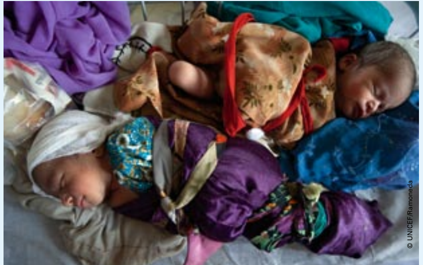
Nýfæddir tvíburar í spítalavöggum í flóttamannabúðum í Norðvestur-Pakistan. UNICEF veitir nú mörg hundruð flóttakönur nauðsynlega aðstoð fyrir, eftir og á meðan fæðingu stendur.

„Flestar þessara kvenna hafa orðið fyrir miklum áföllum og