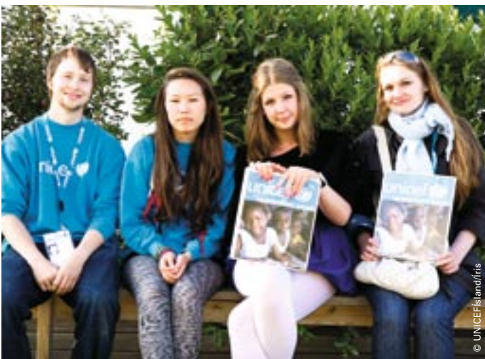
Hér má sjá hluta af hópnum í Breiðholti.

Frá því í júní hefur vaskur hópur ungmenna gengið skipulega í hverfi á höfuðborgarsvæðinu og boðið fólki að slást í hóp heimsforeldra. Hópnum hefur verið vel tekið hvar sem hann hefur borið niður og þökkum við almenningi kærlega fyrir jákvætt viðmót í okkar garð. Það sem af er sumri hafa hátt í sex hundruð nýir heimsforeldrar bæst í hópinn sem telur nú yfir fjórtán þúsund Íslendinga. Öllu þessu fólki þökkum við kærlega fyrir ómetanlegan stuðning.