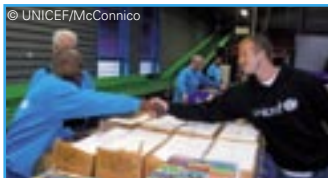
David Beckham, velgjörðarsendiherra UNICEF, heimsótti birgðastöðina í Kaupmannahöfn þar sem starfsmenn unnu dag og nótt við að pakka gögnum til hamfarsvæðanna við Inlandshaf í byrjun árs 2005.

Birgðastöðin í Kaupmannahöfn hefur þróað 30 mismunandi pakkka. Algengustu pakkarnir, þegar um neyðaraðstoð er að ræða, eru heilsugæslupakkinn (health kit), skólapakinn (school-in-a-box) og leikjapakinn (recreational kit). Birgðastöðin hefur einnig aðstoðað við uppbyggingu á öðrum þökkunarstöðvum í þróunarlöndunum sjálfum, og leggur mikla áherslu á að nýta sér vinnuafli á hverjum stað fyrir sig.