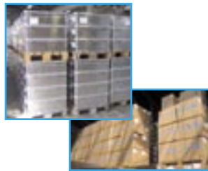
Fullbúnir skólapakkar í Kaupmannahöfn tilbúnir til sendingar.